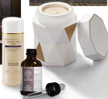
Лосьон-эксфолиант для лица P50 1970, Biologique Recherche, 6 800 р.; сыворотка для кожи головы Activ Croissance, Clauderer, 6 500 р.; антивозрастной крем для лица La Grande Crème, Biologique Recherche, 36 800 р.